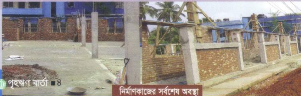
নির্মাণকাজের সর্বশেষ অবস্থা

সাম্প্রতিক বছরগুলোতে কর্পোরেশনের ব্যবসায়িক কার্যক্রমে সফলতার পাশাপাশি অবকাঠামোসহ বিভিন্ন ক্ষেত্রে ব্যাপক উন্নয়ন কার্যক্রম বাস্তবায়িত হচ্ছে। প্রতিষ্ঠানের প্রতিটি সম্পদ এবং সবটুকু সামর্থ্যের সর্বোচ্চ ব্যবহার নিশ্চিত করনের লক্ষে সবারকমের উদ্যোগ নেয়া হচ্ছে। বিগত তিন দশকেরও বেশি সময় ধরে অনুৎপাদনশীল ও অব্যবহৃত (১.১৫ একর) জমির উপর নিজ স্থাপনা নির্মাণের উদ্যোগ এরই অংশ মাত্র। উল্লেখ্য, নিজস্ব জমিতে কার্যালয় স্থাপনের মধ্যদিয়ে প্রতিষ্ঠানটির উন্নয়ন অগ্রযাত্রায় আরেকটি মাইলফলক স্থাপিত হতে চলেছে।